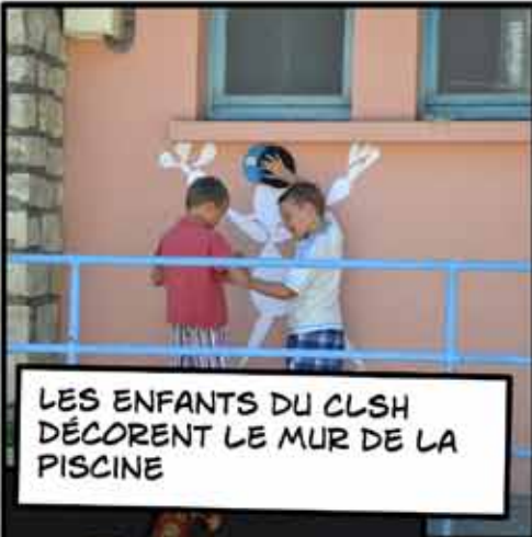
LES ENFANTS DU CLSH DÉCORENT LE MUR DE LA PISCINE