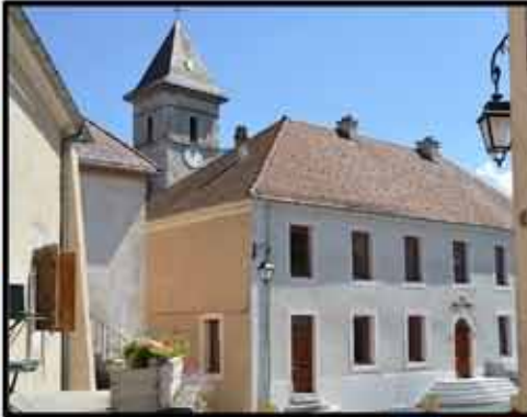
FIN DES TRAVAUX DE LA MAIRIE