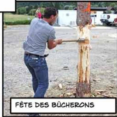
FÊTE DES BÛCHERONS