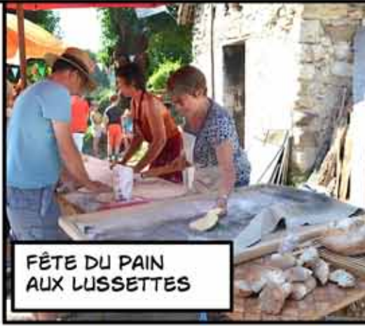
FÊTE DU PAIN AUX LUSSETTES