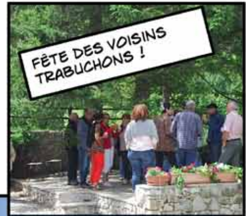
FÊTE DES VOISINS TRABUCHONS !